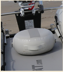
Flachsitz LX + S PAA