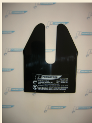
Permatrim M4/5 PAA