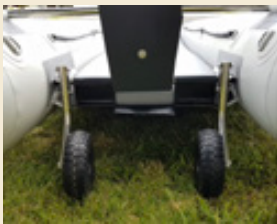
Slip-Räder LX/LS/S PAA

Das folgende optionale Zubehör ist für die meisten Modelle erhältlich. Weitere Informationen erhalten Sie bei Takacat.