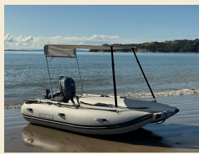
Top Bimini 87/97 LX/S PAA