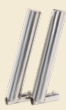
Rod Holders LX/LS/S PAA